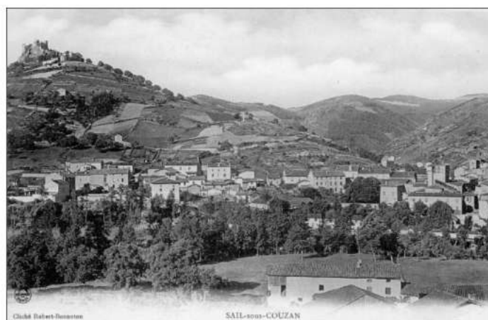
Vue générale de Sail-sous-Couzan

Partons donc à la découverte de l'histoire de ce prieuré bénédictin.